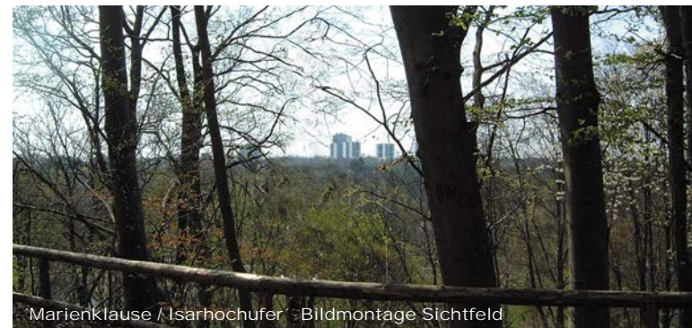
Marienklause / Isarhochufer - Bildmontage Sichtfeld