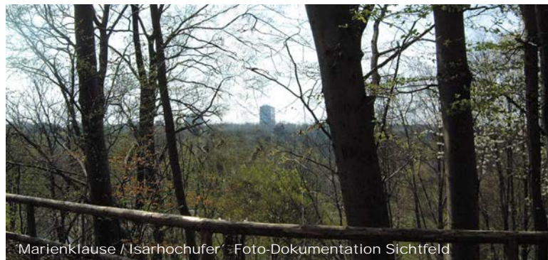
Marienklause / Isarhochufer - Foto-Dokumentation Sichtfeld