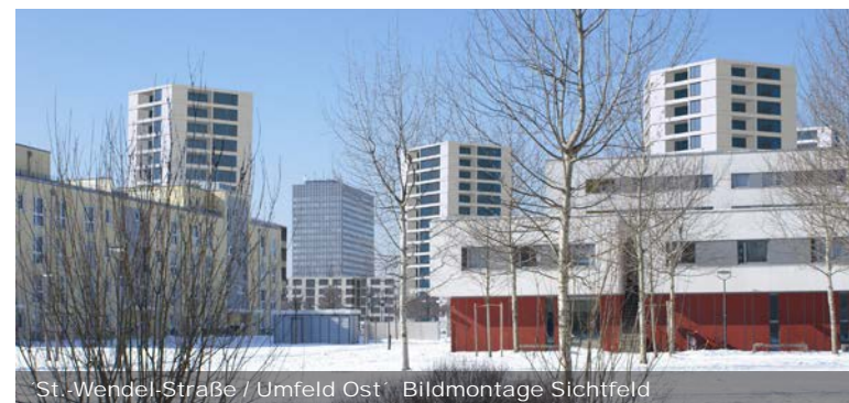
St. Wendel-Straße / Umfeld Ost - Bildmontage Sichtfeld