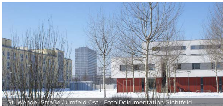
St. Wendel-Straße / Umfeld Ost - Foto-Dokumentation Sichtfeld