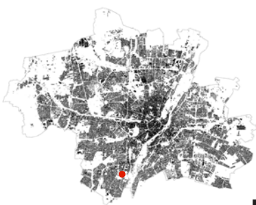
Bebauungsstruktur München N