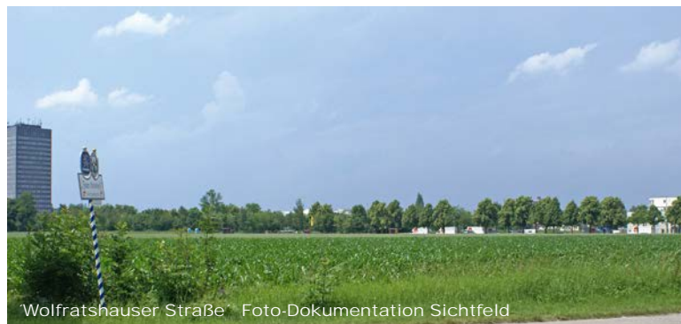
'Wolfratshauser Straße' - Foto-Dokumentation Sichtfeld