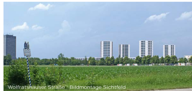
'Wolfratshauser Straße' - Bildmontage Sichtfeld