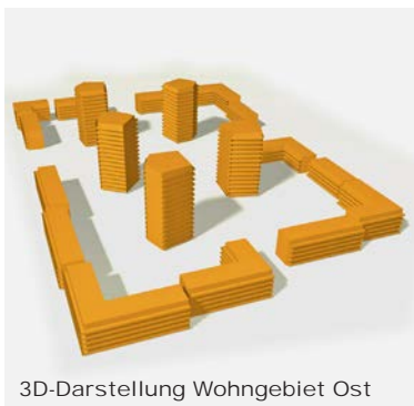
3D-Darstellung Wohngebiet Ost